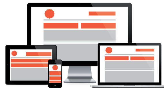
SITE INTERNET VITRINE