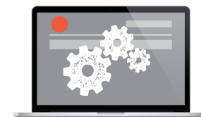
FORMATION prise en main interface cms site internet vitrine